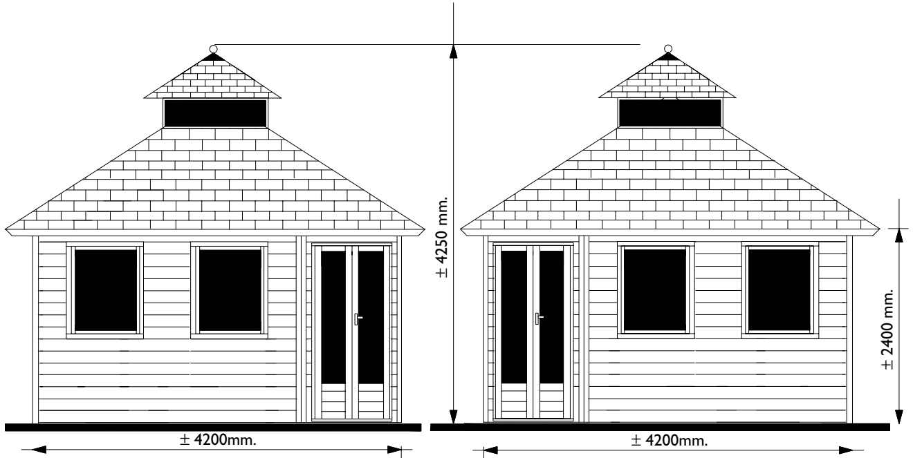
Voor aanzicht Vorder Ansicht Front view

Het is niet toegestaan om bouwsystemen, bouwtekeningen en foto's van zowel de Prima-serie als blokhuizen-serie, teksten etc. geheel of gedeeltelijk over te nemen zonder schriftelijke toestemming van LUGARDE®/Wuestman B.V. Model- en materiaalwijzigingen en drukfouten onder voorbehoud. LUGARDE en het 3=1 systeem zijn geregistreerde handelsmerken. Het Prima 3=1 systeem is ontwikkeld en gepatenteerd door LUGARDE®/Wuestman B.V.